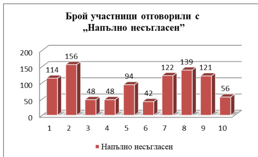
Графика № 1 Брой отговорили участници с „Напълно несъгласен”

Анализът на резултатите на въпрос № 8 (вж. Графика №1) „ Аз се опитвам да бъда без предрасъдъци към хората с увреждания под натиска на другите ”, показва, че 139 участника са дали отговор „ Напълно несъгласен ”. Изводът, който се налага е, че младите хора не се съобразяват с мнението на околните, когато общуват с хора с увреждания. Участниците встъпват в процеса на общуване с хора с увреждания, така както им „диктуват” техните разбирания, възпитание и изградено отношение към лицата с увреждания. Независимо от това 1/4 от респондентите, демонстрират поведение, което очакват да получи одобрението на околните.