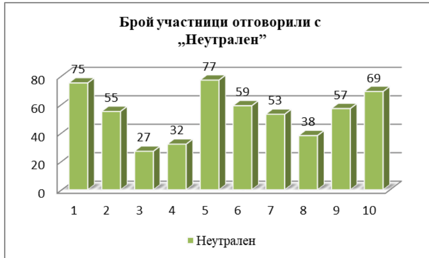
Графика № 2 Брой участници отговорили с „Неутрален”

Интерес за изследването представляват и отговорите на същите тези 10 въпроса, отразени в Графика № 2. Тук най-голямо струпване на участници има в отговорите на въпроси № 1, 5 и 10. И трите въпроса са насочени към търсене на отговор за това как младите хора си взаимодействат с хора с увреждания, при което те оценяват личното поведение на човека с увреждане, поведението на другите спрямо тях в обществото, както и желанието им за участие в различни дейности и действия свързани с елиминирането на предразсъдъци към хората с увреждания.